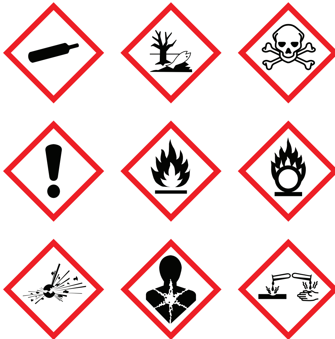
Fiche N°1 - pictogrammes dangers